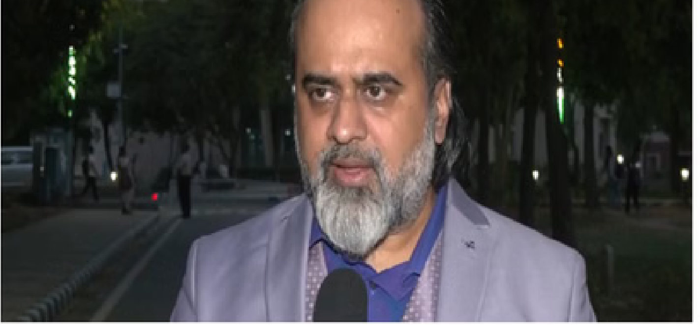
आचार्य प्रशांत